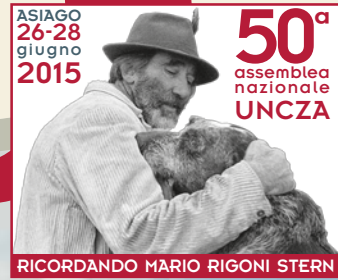
RICORDANDO MARIO RIGONI STERN

ASIAGO 26-28 giugno 2015 Teatro Comunale MILLEPINI